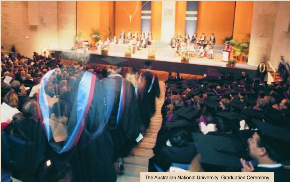
The Australian National University: Graduation Ceremony

Eine ideale Möglichkeit, Studium und Praktikum zu verbinden, ist das Study Abroad & Internship-Programm, das an einigen australischen und an einer neuseeländischen Hochschule angeboten wird. Bis zu 20 Stunden arbeitet man während der Woche in einem Unternehmen, zusätzlich besucht man ein bis zwei Lehrveranstaltungen.