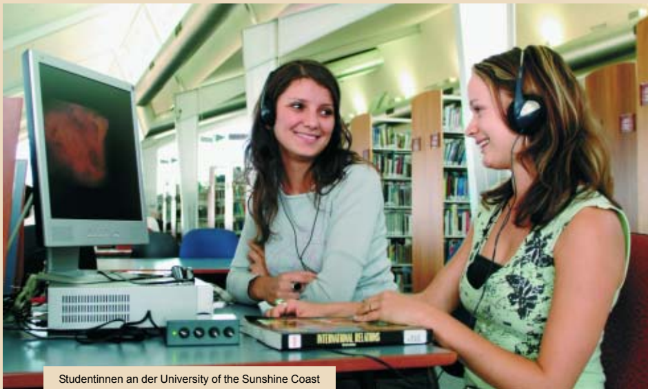
Studentinnen an der University of the Sunshine Coast

Der GMAT (Graduate Management Admission Test) ist kein reiner Sprachtest, sondern prüft neben den Englischkenntnissen auch die analytischen und logischen Fähigkeiten einer Person. Der Test besteht aus einem schriftlichen Teil, in dem zwei analytische Aufsätze à 30 Minuten geschrieben werden, und einem Multiple-Choice-Teil, der mathematische und verbale Fähigkeiten (englische Grammatik und Leseverständnis) misst. Der Multiple-Choice-Teil umfasst zweimal 75 Minuten. Das Gesamtergebnis des GMAT liegt zwischen 200 und 800 Punkten. Im mathematischen und im verbalen Teil werden jeweils 0 bis 60 Punkte vergeben. Das Ergebnis des schriftlichen Teils („analytical writing assessment“ = AWA) geht nicht in die Gesamtpunktzahl ein, sondern wird gesondert auf dem Berichtsbogen ausgewiesen. Es können zwischen 0 und 6 Punkten erreicht werden, wobei das Ergebnis in halben Punktzahlen angegeben wird.